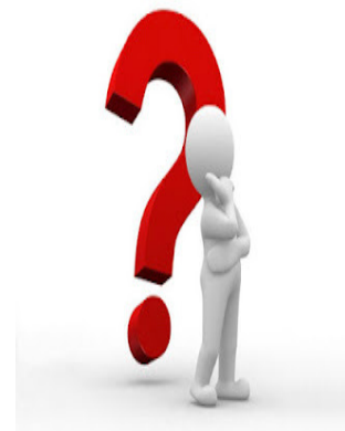
De winnaars van 2012?