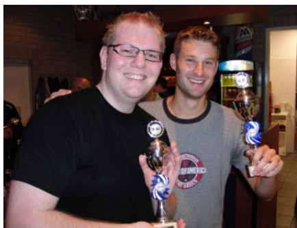
De winnaars van 2010