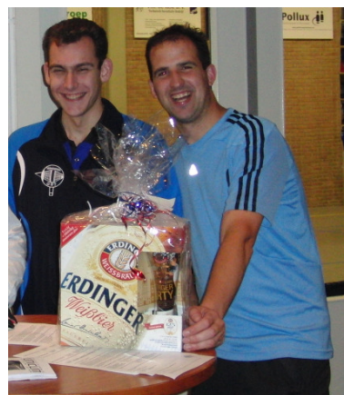
De winnaars van 2011