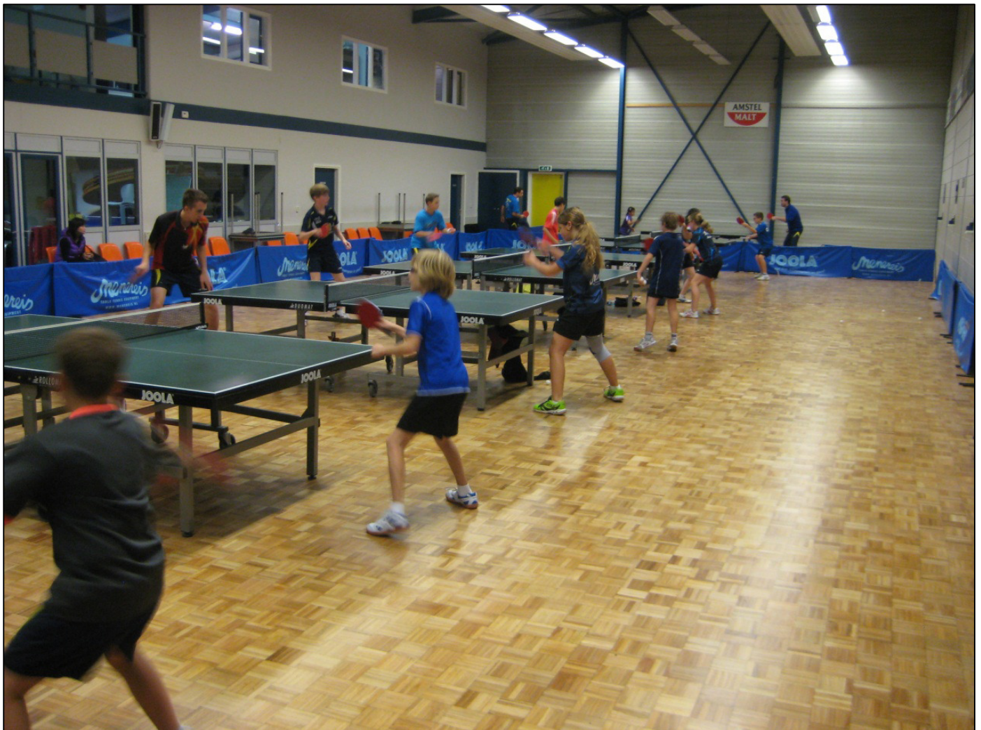
Figuur 2: Spelers actief tijdens de techniektraining